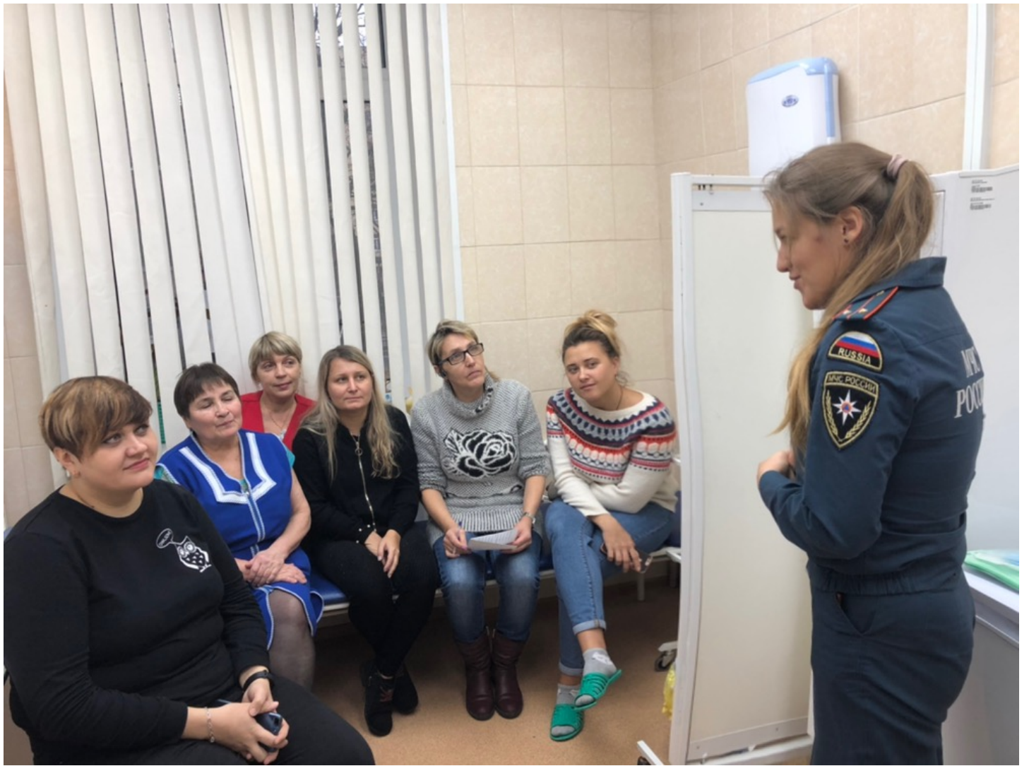
ОНДПР Центрального района 23.11.2018г.